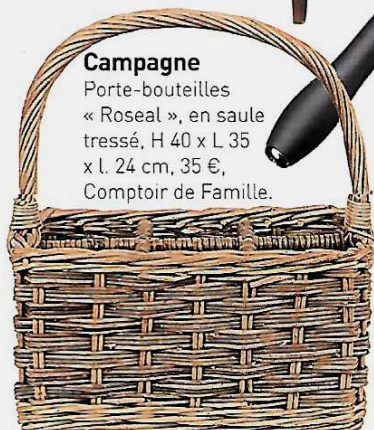
Campagne Porte-bouteilles « Roseal », en saule tressé, H 40 x L 35 x l. 24 cm, 35 €, Comptoir de Famille.