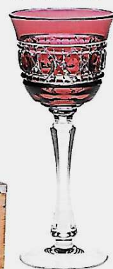
Santé ! Verre à vin rouge « Jacquard », en cristal soufflé à la bouche, 22 cl, 169 €, Cristallerie de Montbronn.