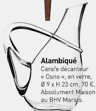
Alambiqué Carafe décanter « Osno », en verre, Ø 9 x H 23 cm, 70 €, Absolutement Maison au BHV Marais.