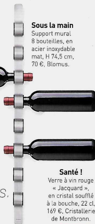
Sous la main Support mural 8 bouteilles, en acier inoxydable mat, H 74,5 cm, 70 €, Blomus.