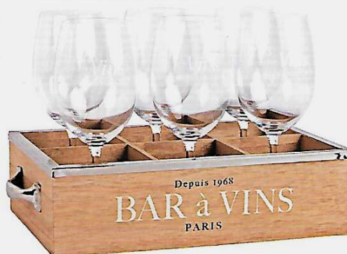
Festif 6 verres à vin dans un coffret en bois, H 8 cm, 35 €, Maisons du Monde.