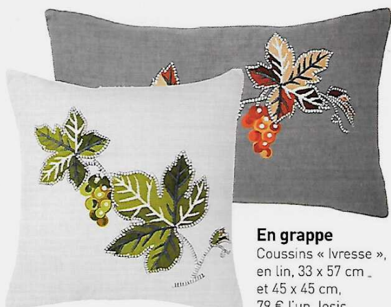
En grappe Coussins « Ivresse », en lin, 33 x 57 cm et 45 x 45 cm, 79 € l'un, losis.