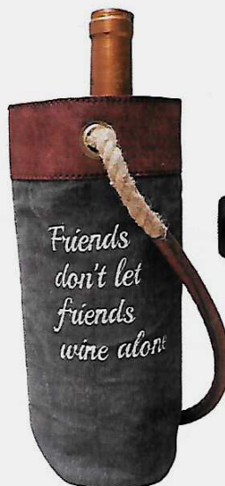
Nomade Sac pour bouteilles en coton, Ø 8 x L 25 cm, 12 €, Chehoma.