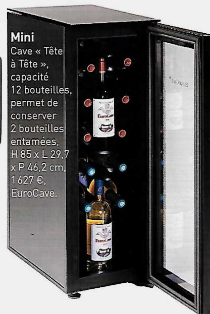
Mini Cave « Tête à Tête », capacité 12 bouteilles, permet de conserver 2 bouteilles entamées, H 85 x L 29,7 x P 46,2 cm, 1 627 €, EuroCave.

Labus d'alcool est dangereux pour la santé, à consommer avec modération.