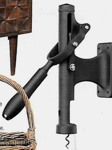
Mural Tire-bouchon en acier galvanisé, mécanisme levier à engrenage, 111 €, Bar Craft.